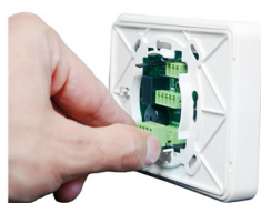
Rozłączne listwy zaciskowe

Wizualizacja i sterowanie automatyką domową.