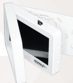
Obsługa kart SD: plan obiektu, cyfrowa ramka