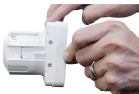
Montaż na typowej puszcze instalacyjnej f60